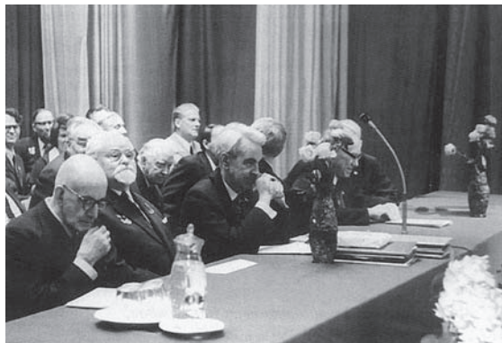
На заседании ИПМ. В первом ряду П.С. Александров, А.Н. Тихонов, М.В. Келдыш, М.А. Лаврентьев. 1973 г.