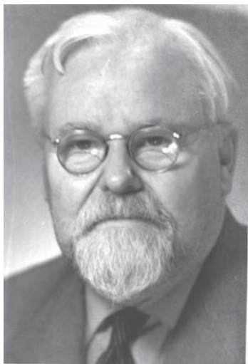
Академик Андрей Николаевич Тихонов