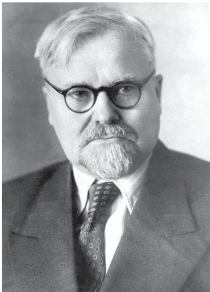
А.Н. Тихонов. 1946 г.