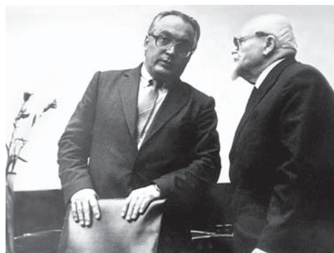
В.А. Садовничий и А.Н. Тихонов. 1981 г.