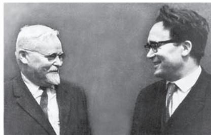
А.Н. Тихонов и А.А. Самарский (около 1970 г.)